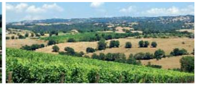
PODERE SPADINO Maremma